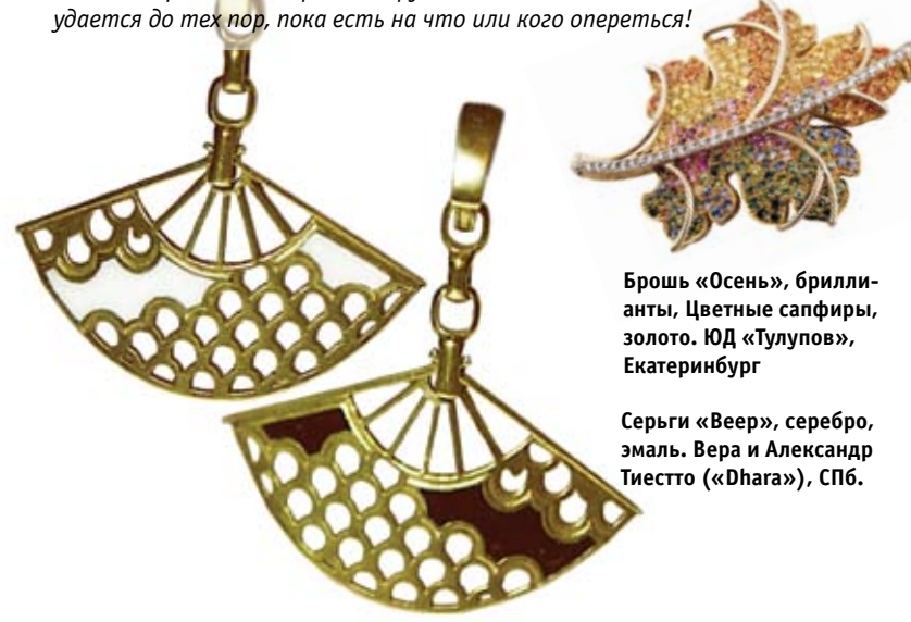
Брошь «Осень», бриллианты, Цветные сапфиры, золото. Юд «Тулупов», Екатеринбург

Весы! Играйте, экспериментируйте, но помните, что Вам все удастся до тех пор, пока есть на что или кого опереться!