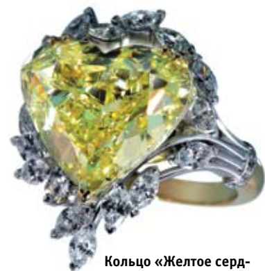
Кольцо «Желтое сердце», бриллианты, золото. «Смоленские бриллианты», Смоленск (1-е место в номинации «Кольцо» конкурса «ЛУЧШИЕ УКРАШЕНИЯ РОССИИ 2010»).