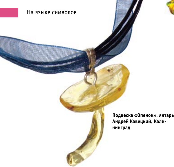
Подвеска «Опенок», янтарь. Андрей Кавецкий, Калининград