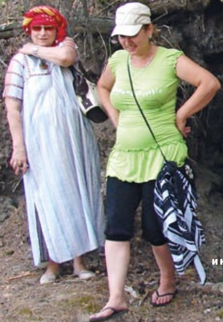
Веселая ярмарка и концерт на Фестивале в Красном Ясыле