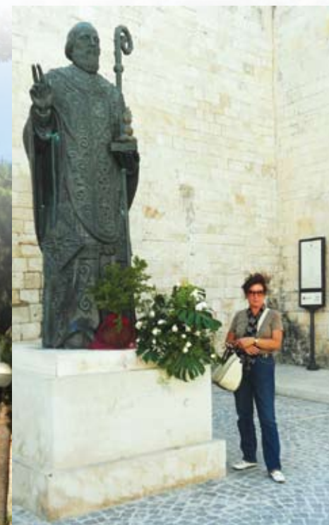
Русское подворье в Бари

Но чудеса все-таки происходят. А в Бари они просто не имеют права не случаться! Моя очаровательная подруга, увидев, что мы увлеченно снимаем архитектурные шедевры столицы итальянского юга, вдруг куда-то исчезла на мгновение (это бывает порой со сказочными персонажами