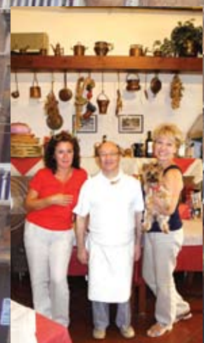
В ресторане "Grotto azzurro" у Доменика, нашего доброго Гудвина