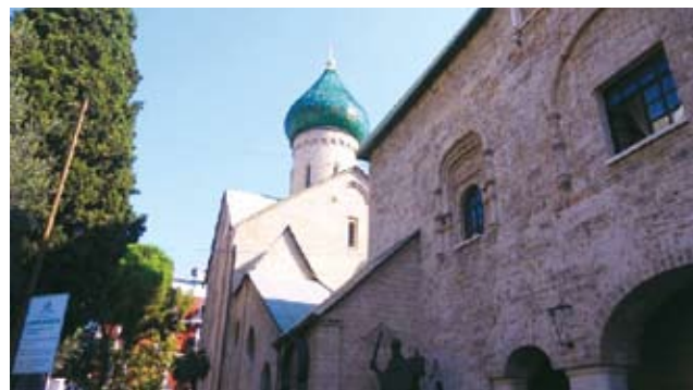
В двух шагах от чудес

Еще Бари гостеприимен. Мы уже говорили о том, что в великолепной во всех отношениях Италии есть существенный недостаток, который вызывает недоумение, а порой и негодова-