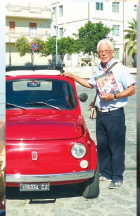
Старый добрый Фиат «чинквеченто» и наш постоянный читатель

15-летний опыт работы в международном туризме. Калабрия – встреча-проводы, трансферы, заказ частных вилл, апартаментов, яхт, экскурсии, сопровождение, содействие в покупке недвижимости, синхронный перевод, полный пакет услуг на юге Италии. s.alena06@mail.ru, тел.: +7 906 23 00, + 385 91 586 94 59 (Хорватия), +39 33 32 25 56 43 (Италия)