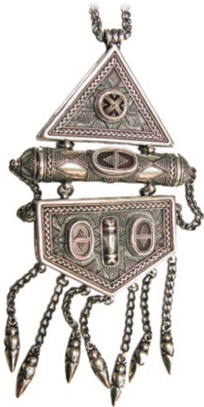
▲ Комплект женских украшений, серебро. Берик Алибай. 2-е место в номинации «Историческое наследие»

активный, гибкий и самоотверженный. Только на таких людях держится Земля. Это те люди, кто «лучше не доспит — не доест», но сделает свое намеченное дело в срок и качественно. Ей захотелось сначала объ-