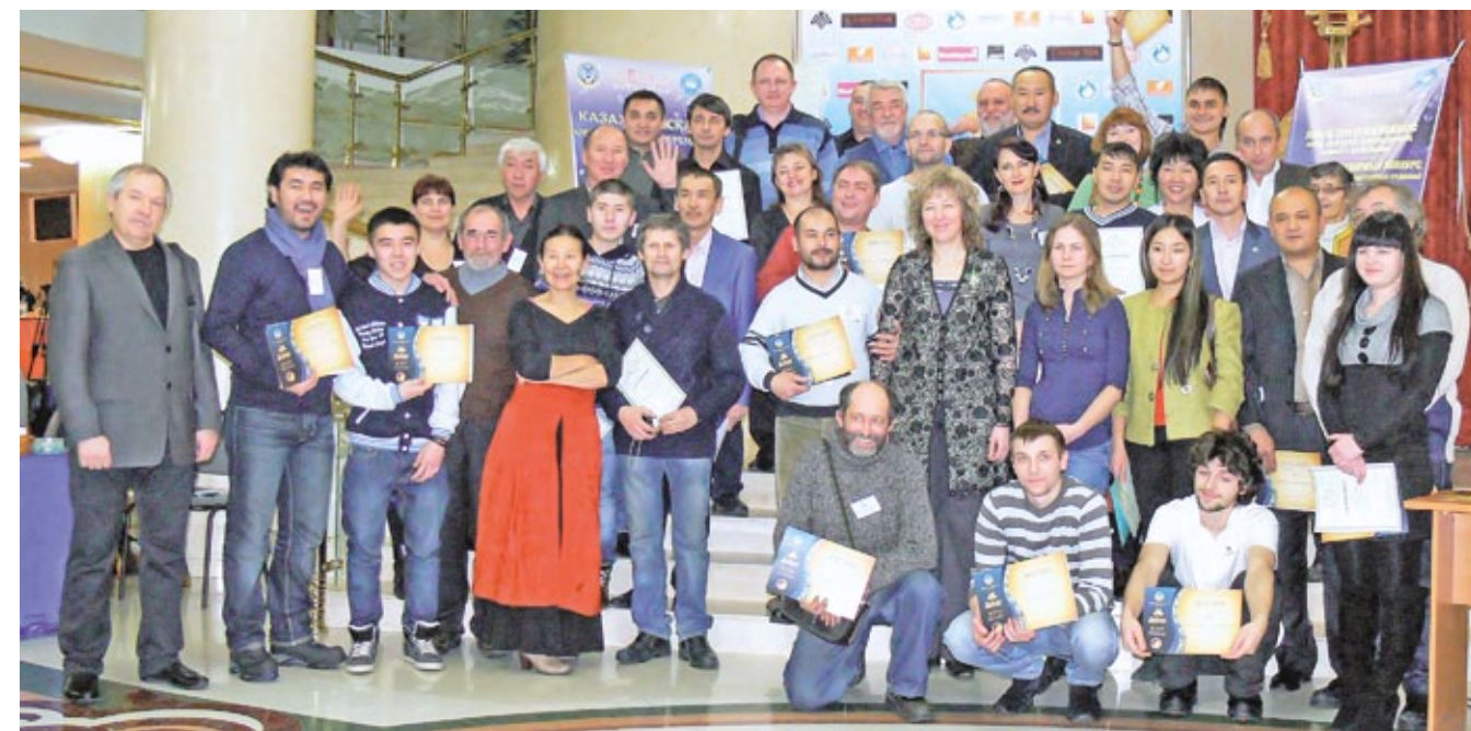
▲ Участники конкурса