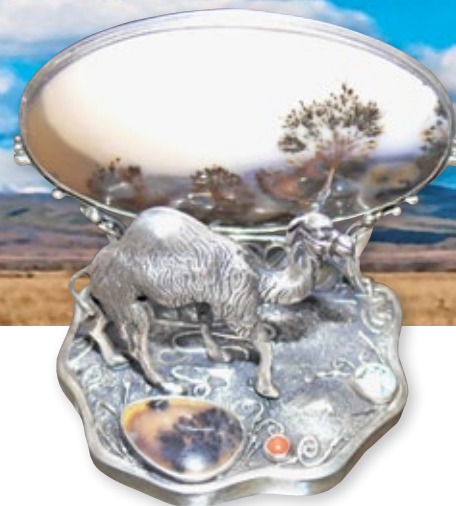
▲ Миниатюра «Верблюды», пейзажный халцедон, серебро. Берик Алибай