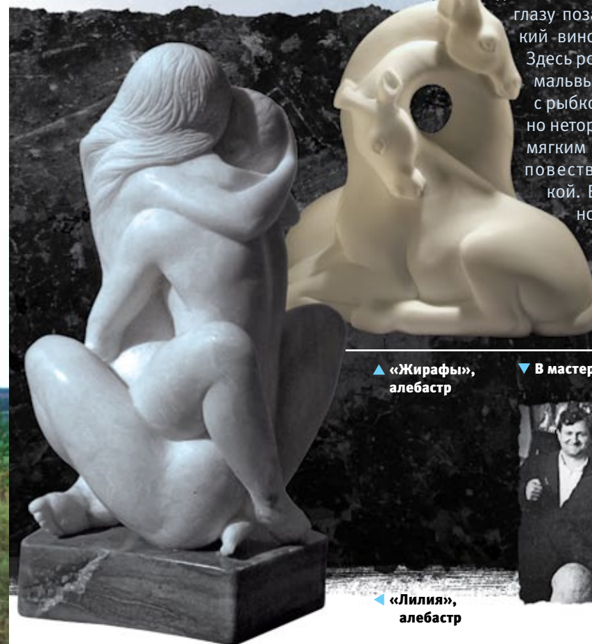
▲ «Жирафы», алебастр

Родился 10 февраля 1939 г. в селе Красный Ясыл Ординского района Пермской области, художник-камнерез, член Союза художников СССР (1970), заслуженный художник РФ (1998), член творческого объединения «Камнерезное искусство России». Окончил Кунгурскую камнерезную профтехшколу (1956), с 1956 по 2002 г. работал на художественном комбинате «Уральский камнерез» (с. Красный Ясыл) сначала мастером-резчиком, с 1978 г. — главным художником комбината. Участник многочисленных выставок в России и за рубежом: международные торгово-промышленные в Осаке (1970), Монреале (1973); всемирная в Ганновере ЭКСПО-2000 (Германия) и т.д. Награжден орденом «Знак Почета» (1977); орденом Дружбы народов (1986)