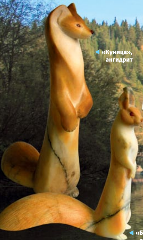
▲ «Куница», ангидрит