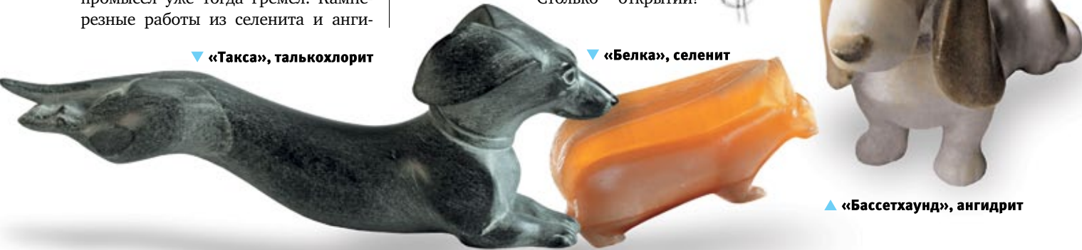
▼ «Такса», талькохлорит

Моисеич. Всегда было интересно — каждое время свое. До оттепели, когда кондовый соцреализм до умопомрачения, пластики как таковой не было. Во время оттепели стала проникать западные арт-течения. Не в камнерезке, конечно, ее на Западе просто не было, но через фарфор, керамику. Лаконизм, абстрактное изображение животных. Это пленяло, подкупало, потому что открывало новые пластические приемы в камне. Вроде бы и упрощение, но острее, больше характера, скупыми средствами: ни дробности вещи, ни расчесывания шерсти, ни вырезания копытца и рожек, что уж как настоящее. Но массами какими-то обобщениями. Появился лаконизм в камнерезных работах. Пошел поиск. Столько открытий!