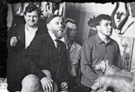
▼ Трое — камнерез, охотник, писатель