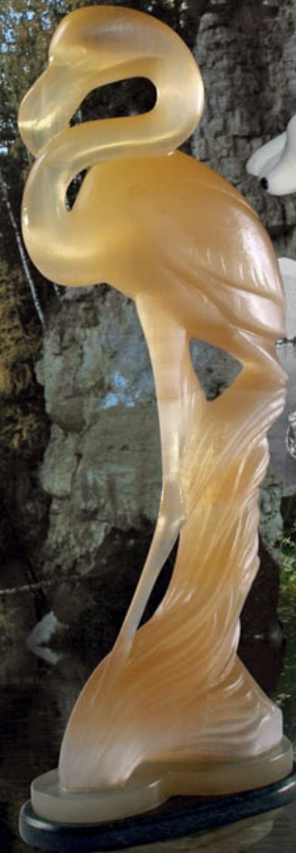
▲ «Фламинго», селенит