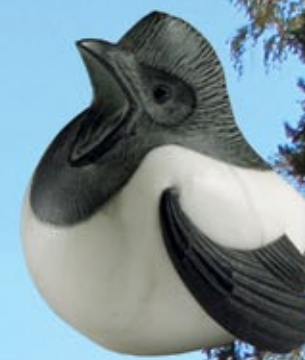
▲ «Сорока», алебастр, талькохлорит

Ангидрит — минерал безводный сульфат кальция, химический состав которого выражается формулой CaSO_4 . Впервые ангидрит был описан в 1804 году немецким минералогом А. Вернером (Abraham Gottlob Werner). Название происходит от «anhydrous» — «безводный» и указывает на отсутствие воды в составе ангидрита, в сравнении с водосодержащим гипсом. Синонимы: безводный гипс (anhydrous gypsum)