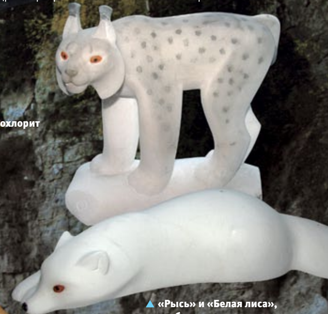
▲ «Рысь» и «Белая лиса», алебастр