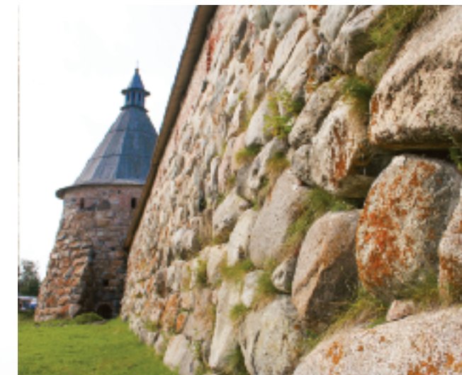
▲ Древние валуны стен

Н аше небольшое судно уткнулось в покрышки на краю кривого пирса в бухте Благополучия, прямо напротив монастыря, уже на грани кромешной тьмы. Поселок Соловецкий не может пока гордиться обилием уличного освещения, но удержать нас на борту не смогла бы и якорная цепь, тем более после того как зажглась подсветка монастыря.