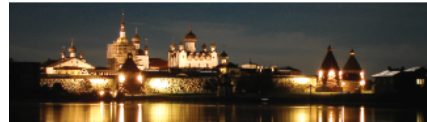
▲ Соловецкий монастырь и бухта Благополучия, такими мы их увидели впервые

Поселок пытались пройти быстро, чтобы попасть на паломническую экскурсию, но не удалось. На широкой