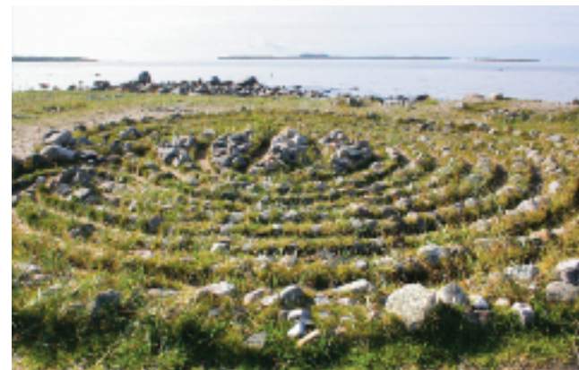
▲ Большой лабиринт

которые предлагают в прокат возле монастыря.