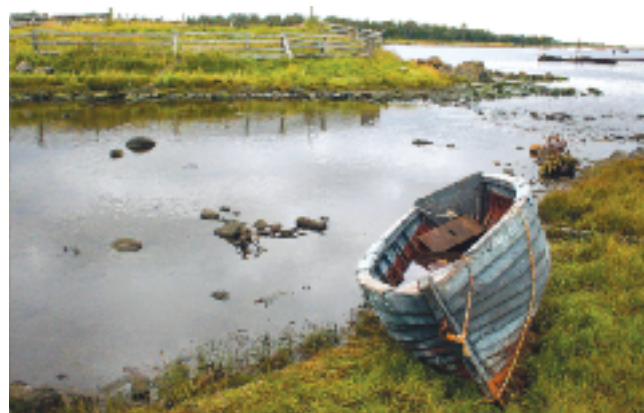
▲ У протоки

Надпись на Переговорном Камне: «Зри сие. Во время войны Турции, Франции, Англии, Сардинии с Россией здесь был переговор настоятеля архим. Александра с английским офицером Антоном Н. 22 июня, в среду в 11 час. до полудня по записке начальника неприятельской воинской эскадры в Белом море, требовавшего от монастыря быков (записка представлена Святому Синоду). После переговоров, благополучных для обители, настоятель, возвратясь в монастырь в 1 час дня, служил в тот день в Успенском соборе Литургию и молебны; служба кончилась в тот день в 4 час. В ту неделю 3 дня пост строгий в обители и скитах, и Господь в это лето не допускал верующих нарушить иноков покой, как без милосердия они поступили в 1854 г.»