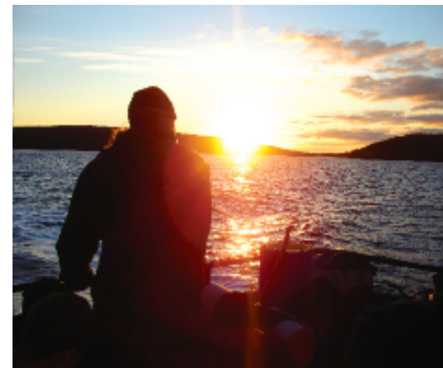
▲ Паломник к святыням Соловецкого монастыря

фото автора, при подготовке использован материал с сайта http://solovki.ca/monastery/monastery.php