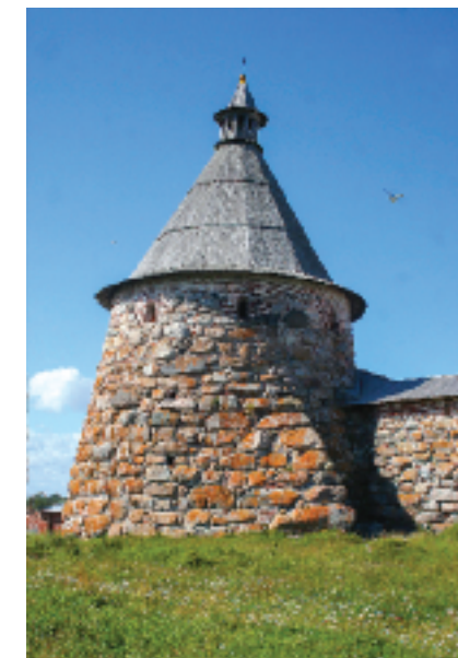
▲ Белая башня

улице, образованной однотипными строениями, мы увидели таблички «Объект культурного наследия. Барак периода УСЛОН до 1928 года», теперь дома служат самым разным целям. Так, например, в одном «барак» мы побывали в колоритном магазине, напомнившим сельпо из моего детства. Этой же улицей, сопровождаемые доброжелательными козами, добрались до берега Святого озера и стен монастыря. Остаток времени до экскурсии провели, во всех ракурсах фотографируя могучие стены и башни, внушительные валуны, с XVI века лежащие в их основании.