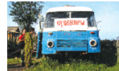
▲ Сувенирная лавка в поселке

с именем игумена Филиппа (Федора Колычева), благодаря его умелым действиям монастырь стал богатым центром промышленности и культуры северного Поморья. При Филиппе строится сеть каналов между многочисленными озерами на Соло-