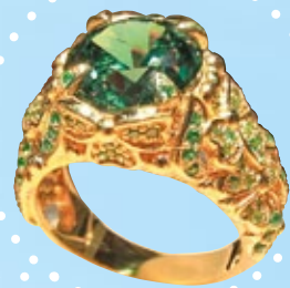
▲ Кольцо «Вертье», золото, демантоид. II место в номинации «Новая форма» (за ювелирное изделие с уникальным уральским демантоидом)