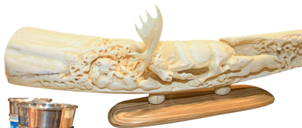
▲ Сувенирное изделие «Волчья охота», бивень моржа. «Русские самородки» (Магадан), автор Сергей Смирнов. Кубок за 1 место в номинации «Новая форма» за профессиональное пластическое выражение сюжетной линии в природном материале