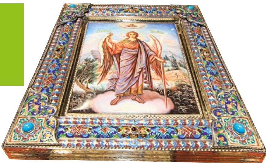
▲ Икона «Ангел Хранитель», подарочный набор (4 стопки на подносе), серебро, горячая эмаль, миниатюрная живопись по эмали (финифть). «Ростовская финифть» (Ростов). Кубок за 1 место в номинации «Стилевая линия» за сохранение и развитие русской традиции эмальерного искусства кубачинских мастеров»